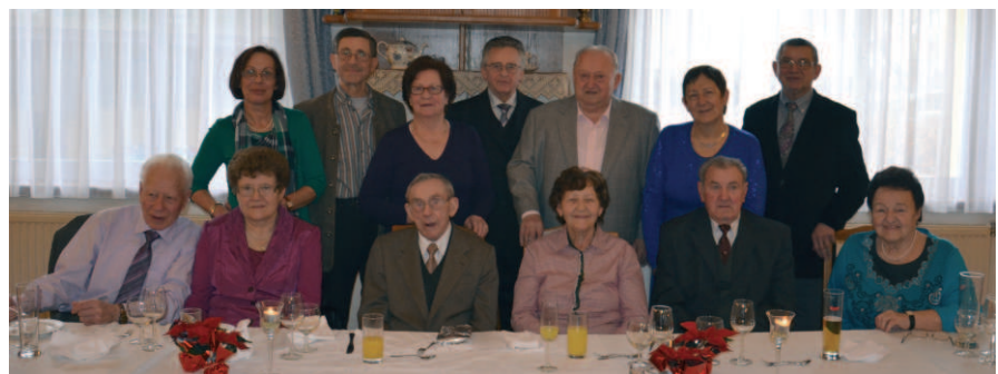
Der Jubilar mit seinen Kindern und Schwiegerkindern...