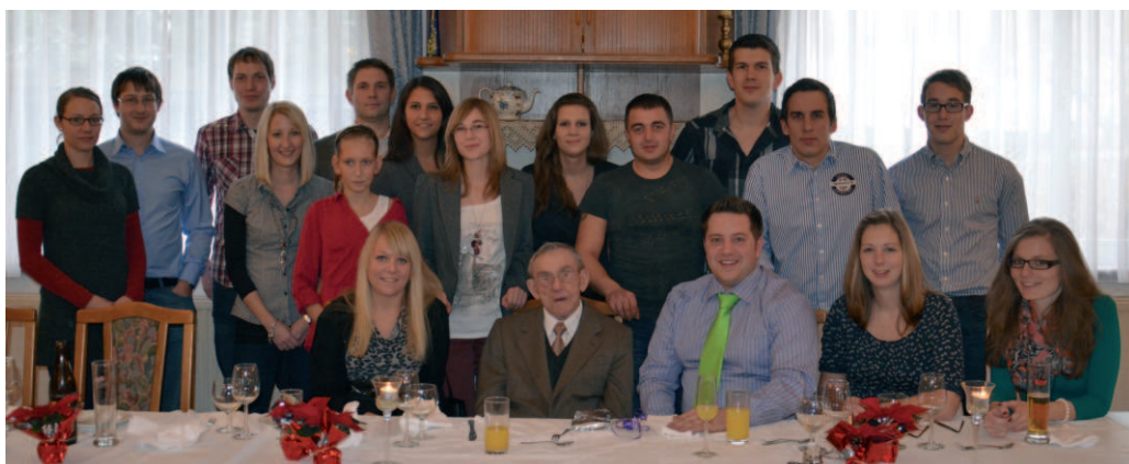
... und im Kreise seiner Urenkelkinder