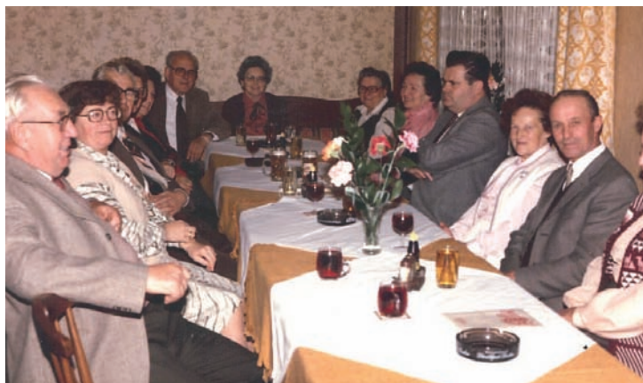
In der Freundesrunde beim gemütlichen Beisammensein

Manchmal nahm er den Atlas zur Hand und zeigte uns die Orte, in denen er gefangen war, tausende Kilometer von seiner Heimat entfernt und erzählte uns Geschichten. Er wollte all diese Plätze aber nie wieder besuchen.