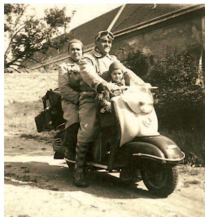
Der Besuch aus Augsburg