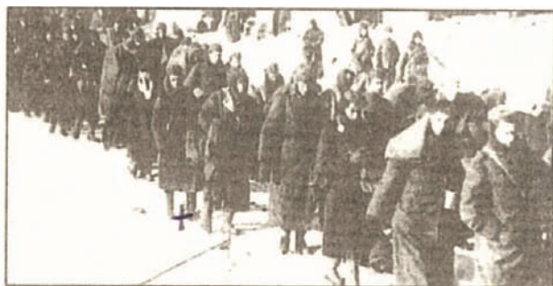
Der Marsch in den Tod: Nur 1200 Österreicher kehrten heim

Döllersheim und andere Dörfer sollten ausradiert werden, einem großen Truppenübungsplatz musste Platz gemacht werden. Es