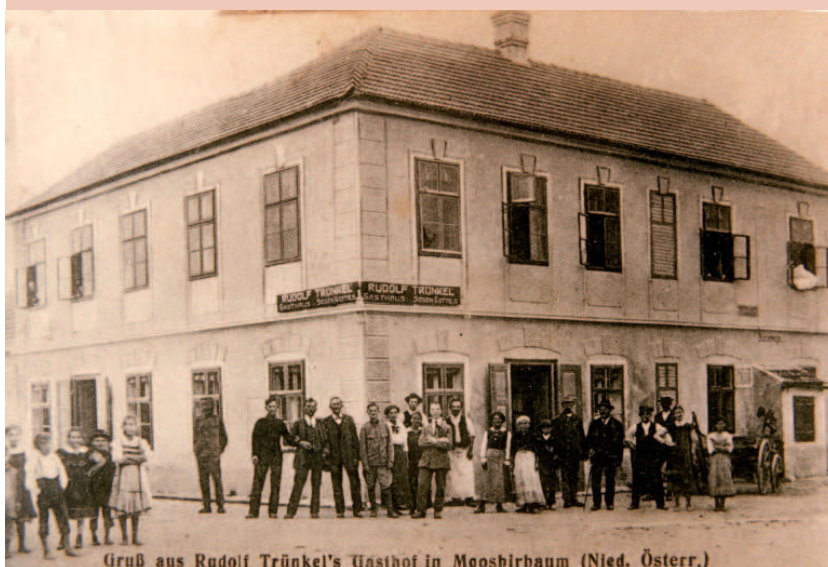
Grüß aus Rudolf Trünkel's Gasthof in Moosbirbaum (Nied. Österr.)

Nach dem 1. Weltkrieg entstand dieses Bild von Rudolf Trünkels Gasthaus „Zum Segen Gottes“ im Zentrum von Moosbirbaum. In diesem typischen Dorfwirtshaus gab es auch Fremdenzimmer und auch eine Brückenwaage ist erkennbar.