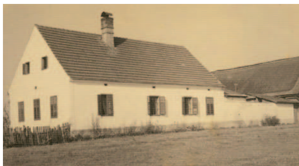
Das Elternhaus in Döllersheim

Nach der Kapitulation in Stalingrad, Franz Fidi hat sich auf dem Bild selbst mit dem Kreuz markiert