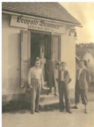
Die Bäckerei Brunner in Döllersheim

hieß aussiedeln – die Heimat verlassen und irgendwo anders hinziehen. So zogen sie also mit Tieren und Hab und Gut fort, weg von Verwandten, Nachbarn und guten Freunden. Ihr neuer Wohnort wurde Atzenbrugg. Meine Großeltern kauften die Landwirtschaft der