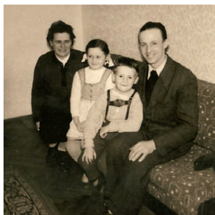
Die Familie im Jahr 1960