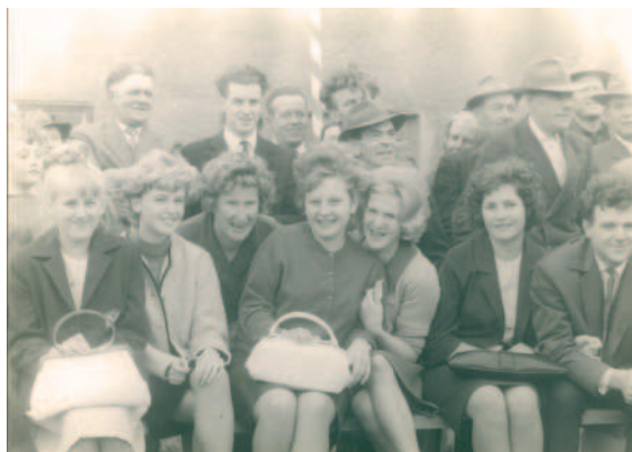
Eine große Schar von Zusehern verfolgt begeistert das Dargebotene