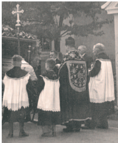
als Mesner (rechts)