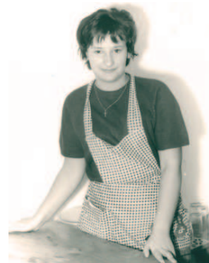
Die junge Haidegger-Traudi, heute als legendäre Waldner-Wirtin schon längst in Pension