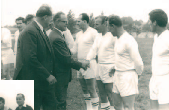
Begrüßung durch den Bürgermeister