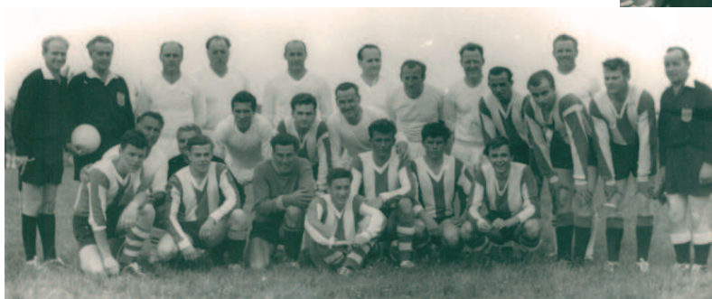
Friedlich vereint vor dem Spiel