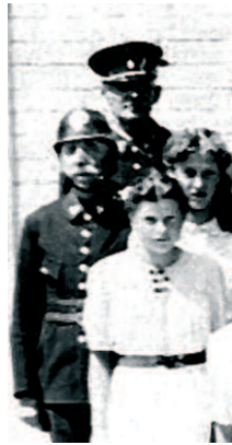
als Feuerwehrmann (im Hintergrund)