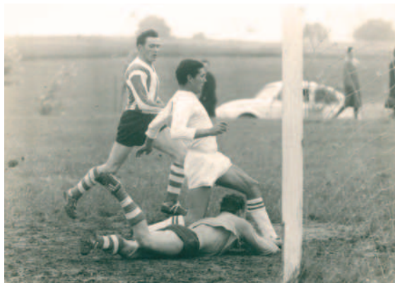
... genau so wie der Draxler-Poldl