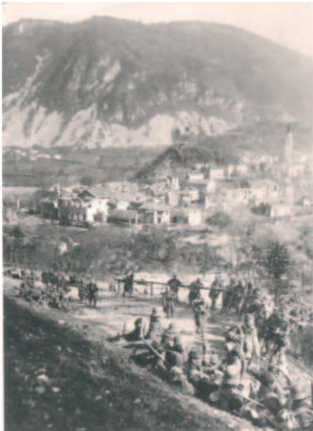
Österreichisch-Ungarische und deutsche Truppen in Wartestellung, im Hintergrund St. Luzia