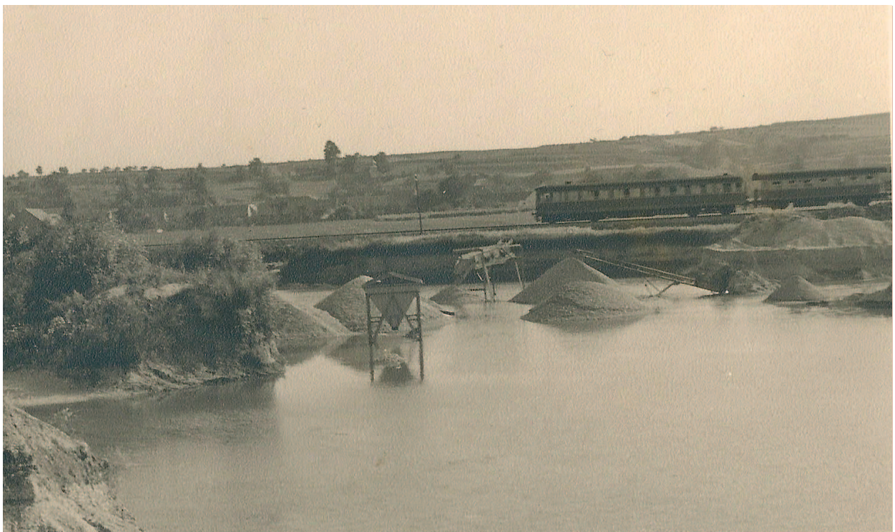
Die Anfänge der „Steiner-Schottergrube“, das Foto ist durch den hohen Grundwasserstand leicht zu datieren, ebenso durch die Triebwagengarnitur, die kurz vor der Einfahrt in die Haltestelle Frasdorf ist. Das Bild entstand also im Frühjahr 1965. Jetzt befindet sich an dieser Stelle die Siedlungsanlage Föhrensee und der Bauhof der Fa. Steiner.

Die an dieser Stelle abgebildeten Häuser und Objekte sehen Sie nur in der Originalausgabe, die die Mitglieder der Moosbierbaumer Heimatkundlichen Runde im Abonnement erhalten.